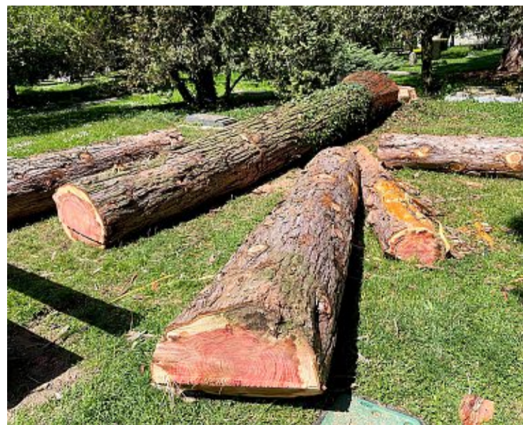
Ce vénérable conifère a vu la tronçonneuse de très près.

Retrouvez les chroniques de Julie sur www.tdg.ch/geneve/encre-bleue ou écrivez à Julie@tdg.ch