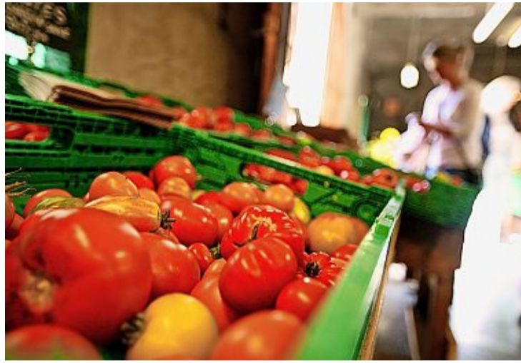
Une vingtaine de structures du canton participent déjà à l'initiative.

Déjà développé en France et en Belgique, le système semble être une première en Suisse. Il repose à la fois sur une forme de solidarité entre les citoyens et l'intérêt des pouvoirs publics à le soutenir, ne serait-ce que par l'économie de coûts sociaux et de santé qu'il est susceptible d'engendrer. Pour l'heure, la Ville de Genève et Meyrin sont engagées dans le projet. Le système est ac-